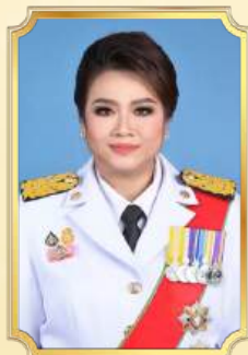
นางสาวศุภมาส อิศรภักดี รัฐมนตรีว่าการ กระทรวงการอุดมศึกษา วิทยาศาสตร์ วิจัยและนวัตกรรม